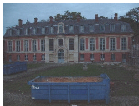
La partie centrale