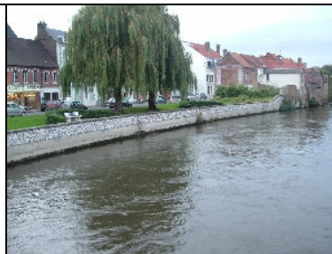
Port de Plaisance.

Vous possédez de très importants revenus en 2006 : Monuments Historiques.