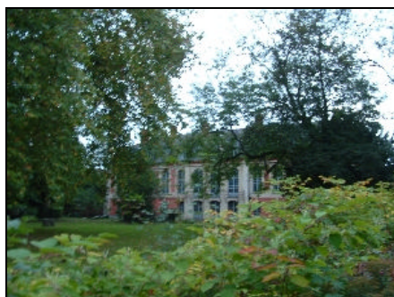
La partie arrière