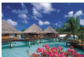
Tahiti, pour le rêve

En complément à la GIRARDIN IMMOBILIERE, appartement, maison en location (Achat par le particulier et non par une entreprise)